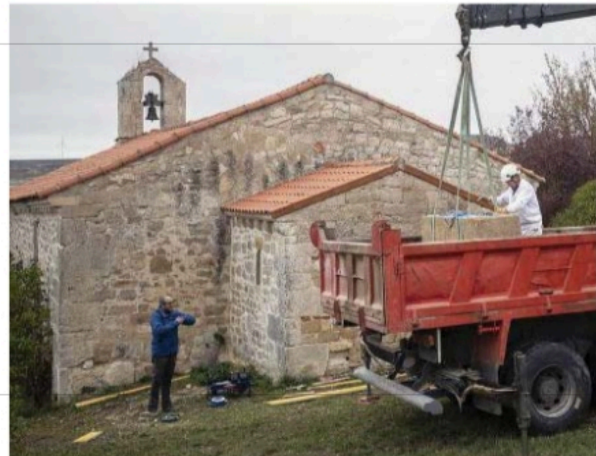
El entorno de la ermita de Montes Claros fue usado como necrópolis durante más

Ades Arqueología realiza este trabajo en colaboración con el equipo de Paleontología de la Universidad de Burgos, el mismo