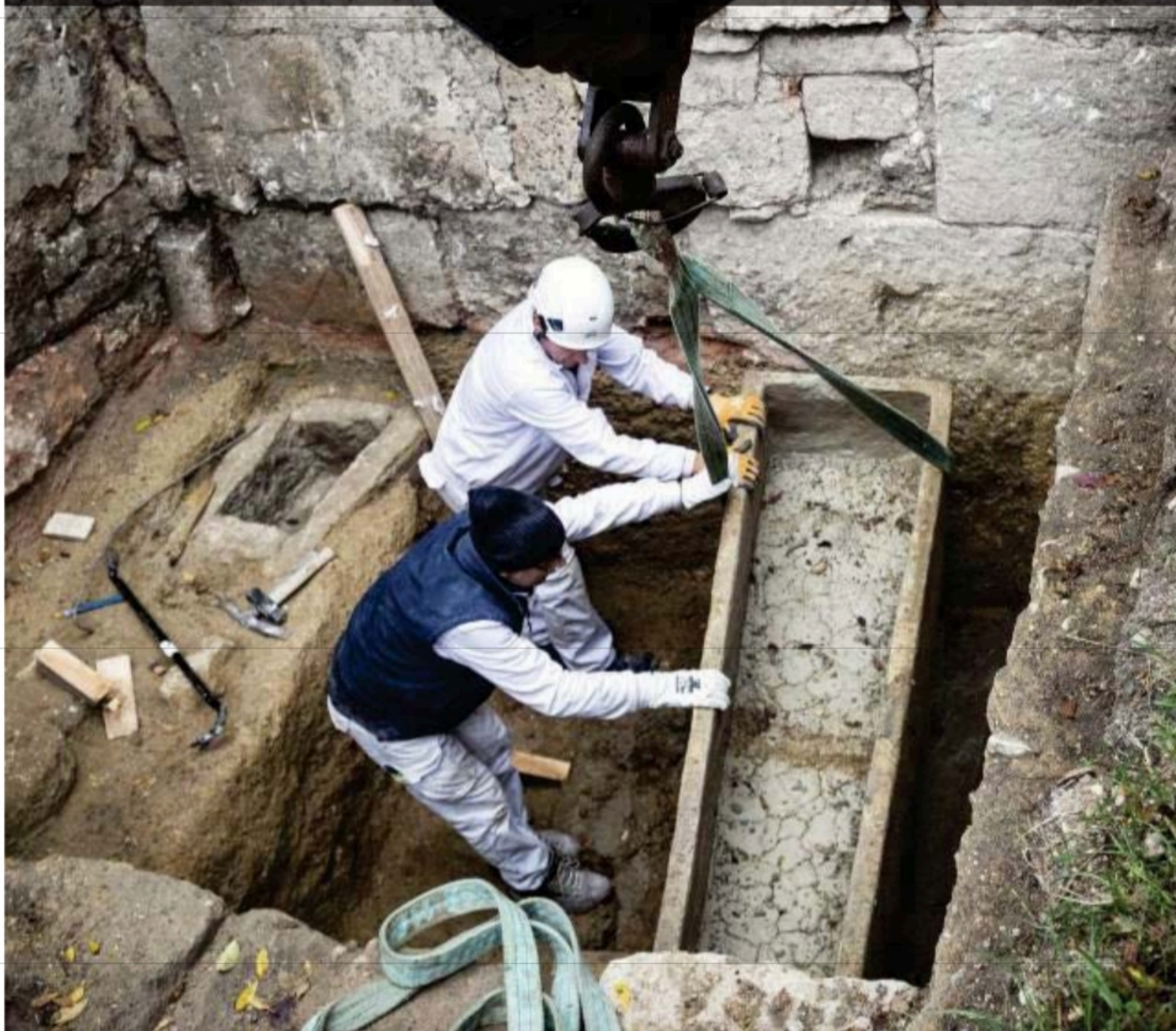
Dos trabajadores de Aibur extraen el segundo sarcófago, dentro del que se puede apreciar perfectamente el cráneo y un húmero del individuo aquí enterrado probablemente en la época visigoda. / PATRICIA