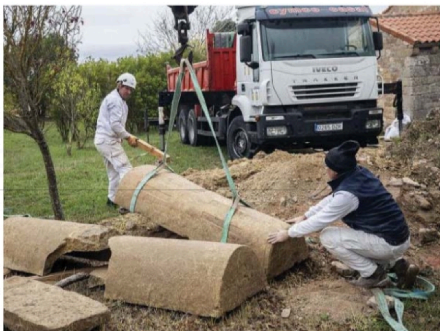
La tapa del sepulcro que se ha extraído intacta es una joya arquitectónica por sus motivos decorativos.

Ubierna, con el apoyo económico de la Diputación Provincial, por plantear un serio proyecto arqueológico que les han permitido no solo excavar in situ, sino también divulgar su trabajo a través del Aula Arqueológica que se abrió en 2021 en la localidad y que acaba de estrenar una nueva sala. Se puede visitar siempre gracias a su inclusión en la red de Museos Vivos.