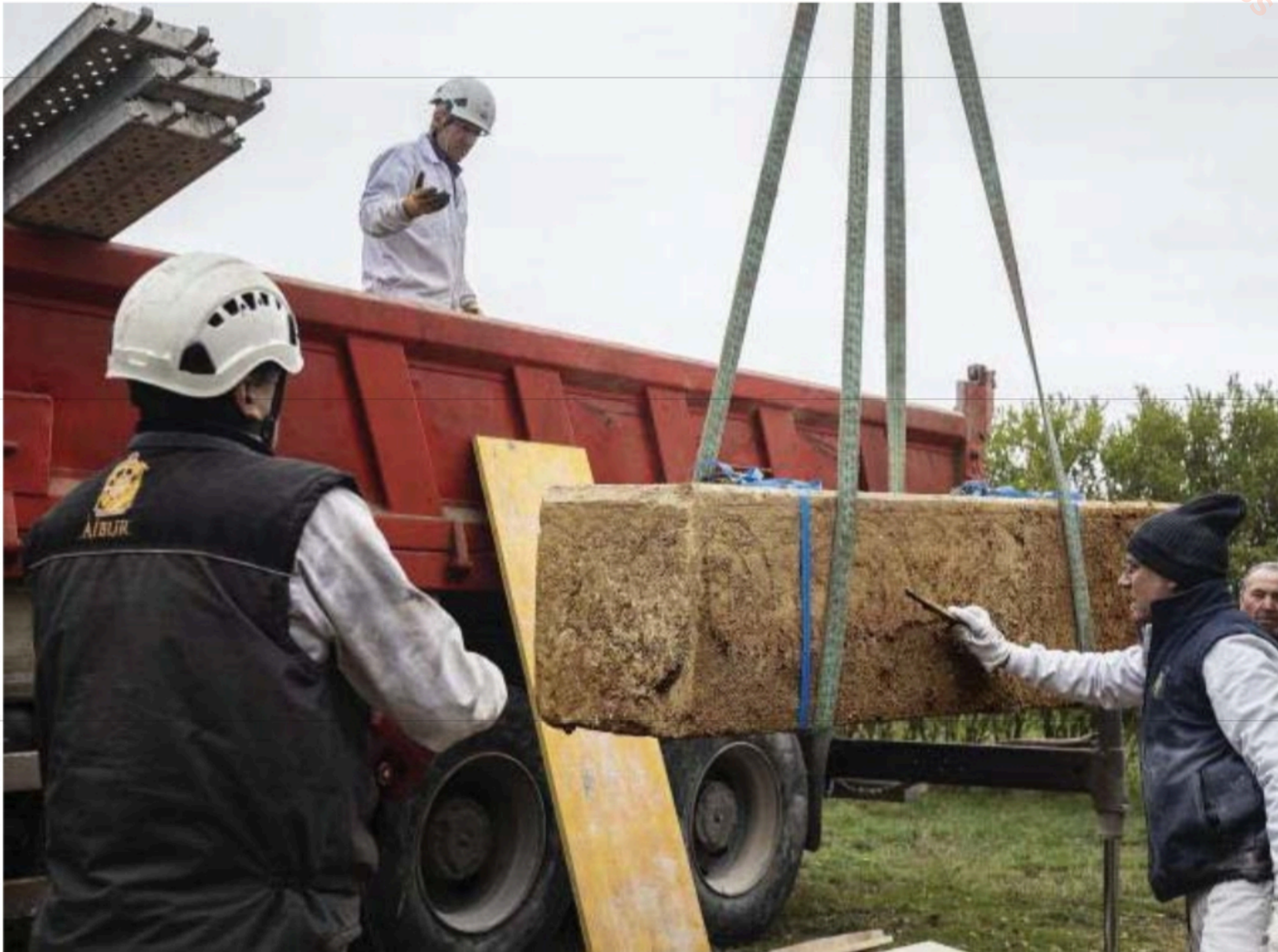
Los trabajadores de Aibur Restauraciones realizaron una operación de extracción perfecta, en unas condiciones complejas, de los sepulcros de piedra caliza. Cada uno de ellos mide dos metros de largo y tiene la caja decorada con