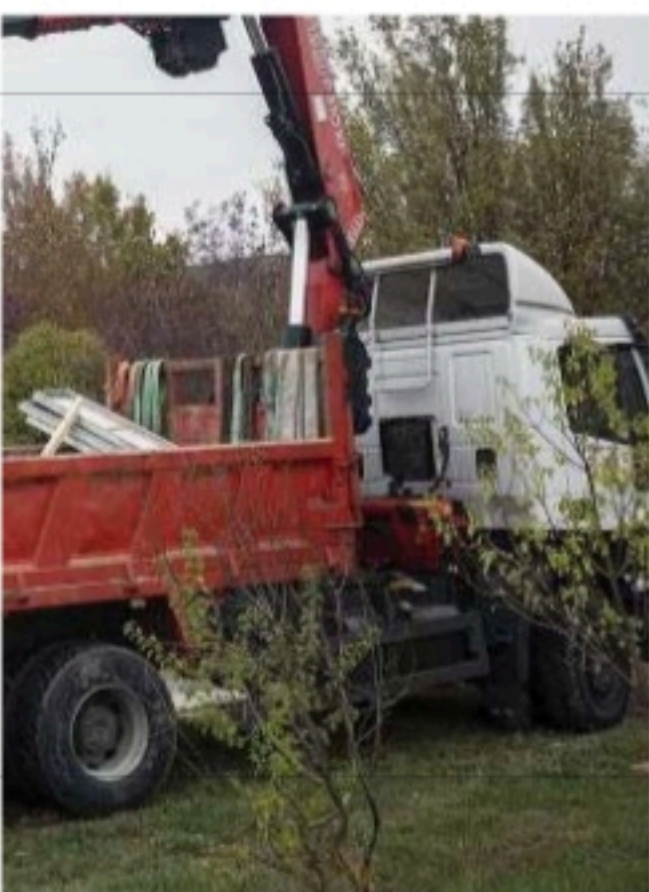
de 1.000 años, entre los siglos III y XIV.

Desde Ades Arqueología destacan la firme apuesta del Ayuntamiento de la Merindad de Río Ubierna y de la Junta Vecinal de