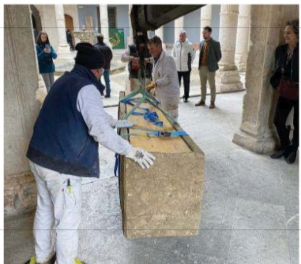
Uno de los sarcófagos a su llegada al Museo de Burgos.